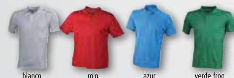
blanco rojo azul verde frog