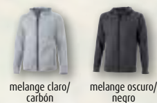
melange claro/ carbón melange oscuro/ negro