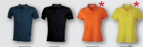
marino negro naranja amarillo