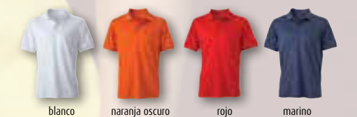
blanco naranja oscuro rojo marino