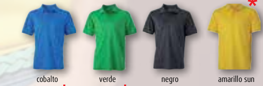
cobalto verde negro amarillo sun