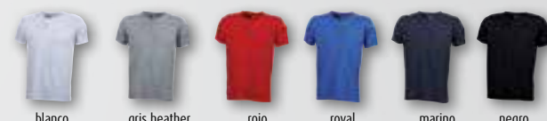
blanco gris heather rojo royal marino negro