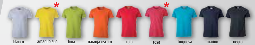
blanco amarillo sun lima naranja oscuro rojo rosa turquesa marino negro