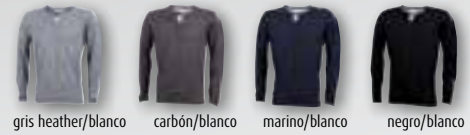
gris heather/blanco carbón/blanco marino/blanco negro/blanco