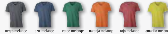
negro melange azul melange verde melange naranja melange rojo melange amarillo melange